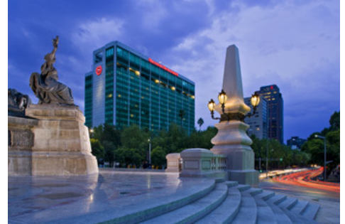
SHERATON MARÍA ISABEL